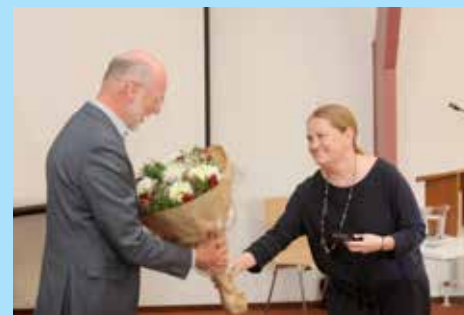
De Oekraïense ambassade feliciteert OGO

scholen als afdeling van de hogescholen. De scholen worden door ca. 8000 leerlingen bezocht.